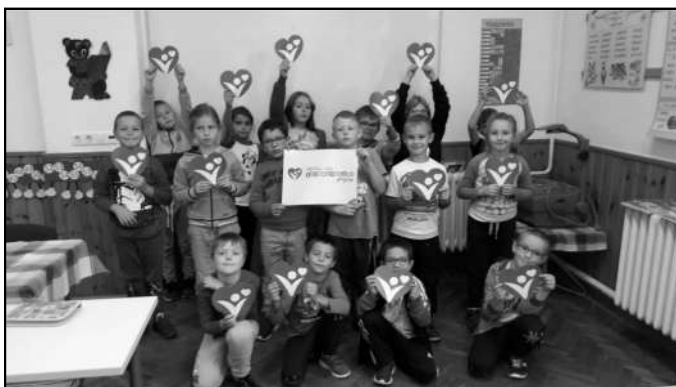
2. osztály tanulói